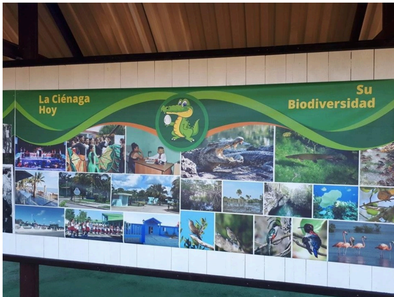
La ciénaga, escenario natural

El alegórico humedal fue escenario de un acontecimiento ansiado por especialistas y promotores en la materia en el insular territorio escogido por la variedad extravagante de sus ecosistemas, un escenario perfecto para realizar toda una galería fotográfica de elevado valor estético.