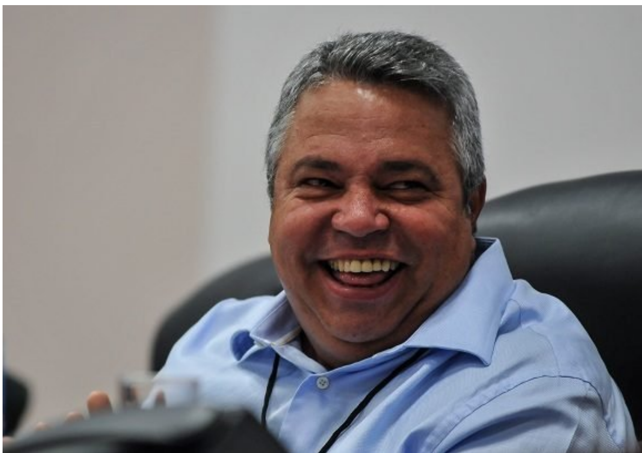
Ulises Guilarte de Nacimiento, Secretario General de la Central de Trabajadores de Cuba

“Arribamos con el compromiso de una clase obrera en el poder, protagonista de la batalla estratégica que hoy vive el país, una batalla por la eficiencia en el terreno económico- productivo, en la que nuestro aporte tiene que ser superior”, asegura Guilarte a Cubadebate .